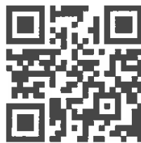
團膳報名 QR Code